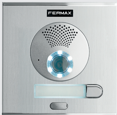
CityKit DUOX PLUS porttelefon med kamera